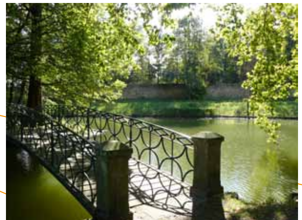
Vues du Domaine de la Verrerie...